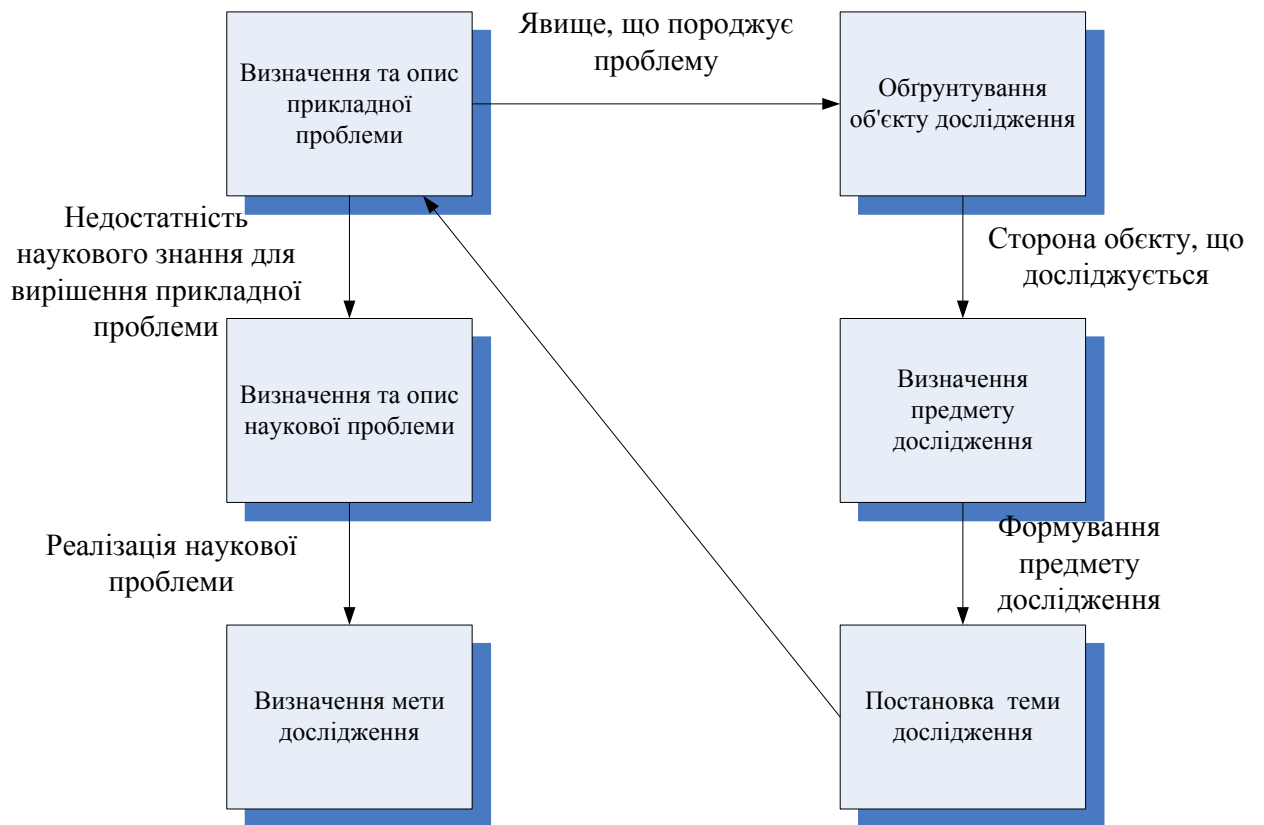
Рис. 4.2. Взаємозв'язок сутності проблеми, мети, об'єкта, предмета наукового дослідження.